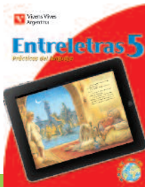
Material de apoyo en CD para docentes