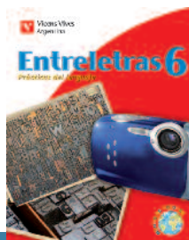
Material de apoyo en CD para docentes