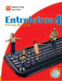
Material de apoyo en CD para docentes